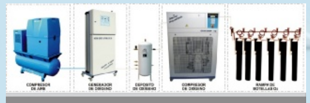
Ejemplo esquemático de una planta de llenado de botellas de oxígeno